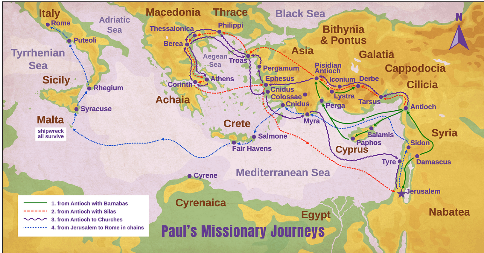
Pauluselt, Kristuse Jeesuse sulaselt, kes on kutsutud apostliks ja valitud levitama Jumala evangeeliumi, - Roomlastele 1:1