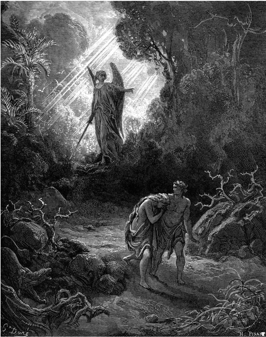
Khi đuổi hai người ra, Đức Chúa Trời Hằng Hữu đặt các thiên thần cầm gươm chói lửa tại phía đông vườn Ê-đen, để canh giữ con đường dẫn đến cây sự sống. Sáng Thế 3:24