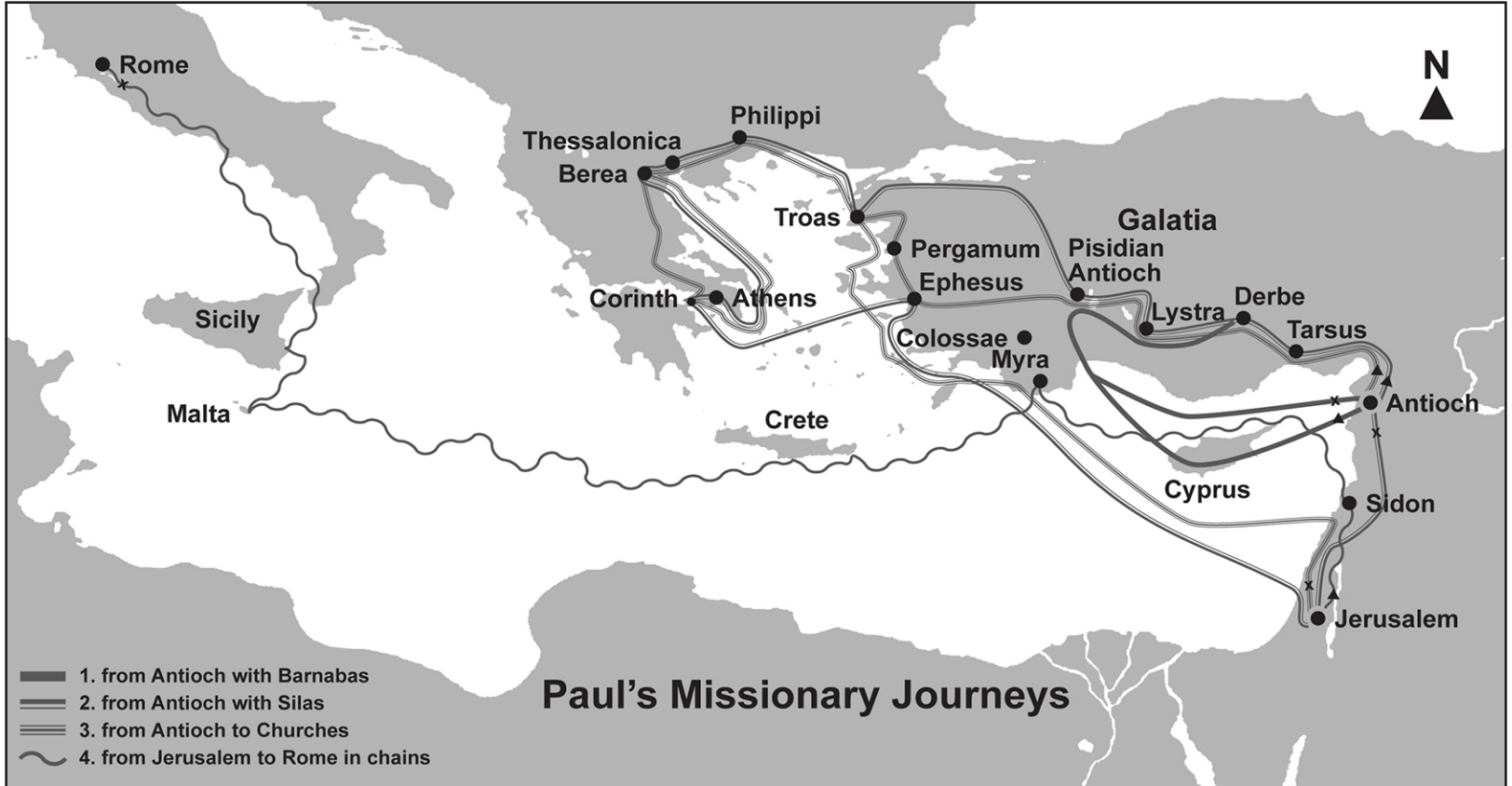
Павел, слуга Ісуса Христа, покликаний апостол, вибраний на благовістування Боже, - До римлян 1:1